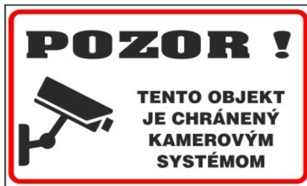
Obr. 1 Označenie priestoru prístupného verejnosti

Ovládacie a záznamové prvky kamerového systému sa nachádzajú na Obecnom úrade.